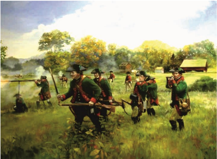
Vorstoß Kasseler Jäger in Amerika (Pamela Patrick)

Während des Krieges in Nordamerika waren ständig 10 bis 12000 Soldaten von Hessen eingesetzt, insgesamt waren es etwas über 20000 gewesen. Nach Kipping starben 4626 Soldaten, 357 bis 535 fielen im Kampf, fast 3000 desertierten. Zu den Desertierten wurden aber auch fehlende Soldaten mit ungeklärtem Schicksal gezählt. Von diesen kehrten ca. 1000 zur Truppe zurück, ihnen wurde danach der Dienstgrad aberkannt, sonst hatten sie keine Nachteile. Gefangen wurden 8029 Soldaten, von denen viele ausgetauscht wurden bzw. wieder zur Truppe zurückkehrten. Einmal liest man von mitgereisten 30 „Weibern“, ein anderes Mal bei Johann Ewald von 60 Amazonen, die als Marketenderinnen eingesetzt wurden, wodurch sich die Stimmung und Disziplin der Soldaten verbesserte. x Vom Angebot des amerikanischen Kongresses, Land zu erhalten und zu siedeln, machten ca. 3000 Gebrauch. 912 Soldaten wurden dimittiert, d. h. entlassen bzw. verabschiedet.