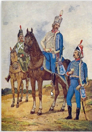
Landgräflich Heiſſiſches Huſarenkorps 1763—1804.

Die Husaren hatten eine ganz besondere Uniform (s. u.), sie blieben aber mit den Kavalleristen in der Heimat.