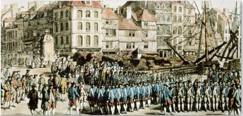
Einschiffung der hessischen Soldaten.

Was hatten die Kasseler aber in Amerika zu suchen? Bereits zu Beginn des Siebenjährigen Krieges 1756 war ein Teil der Kasseler Soldaten aufgrund der mit England geschlossenen Subsidienverträge dorthin verschifft worden, dort aber nicht eingesetzt, weil der erwartete französische Angriff, wahrscheinlich wegen der anwesenden hessischen Soldaten, nicht erfolgte.