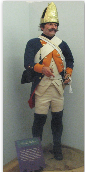
Rechts: Uniform eines hessischen Soldaten im Regiment Lossberg während des Amerikanischen Unabhängigkeitskrieges, Hessian Museum, Carlisle Barracks, Pennsylvania

Die gemieteten Soldaten hatten ihre eigenen Offiziere, nur die Generale waren britisch mit höchst unterschiedlicher Führungsqualität. Das Ersetzen der Soldaten wurde gegen Ende des Krieges immer schwieriger. Die Qualität der Soldaten sank, die Disziplin wurde immer schwieriger, es gab Grausamkeiten, Plünderungen und Vergewaltigungen. Manche dieser Taten wurde den „Hessians“ aber auch in die Schuhe geschoben, um von den Übergriffen eigener Soldaten abzulenken. Unter „Hessians“ wurden auch nicht nur die hessischen Soldaten bezeichnet sondern alle gemieteten Soldaten. Nach Beendigung der Kriegshandlungen in Amerika wurden die Regimenter zu ihren Standorten in Hessen zurückverlegt. Für die hessi-