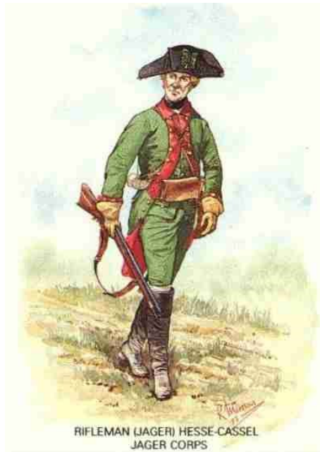
RIFLEMAN (JÄGER) HESSE-CASSEL JÄGER CORPS