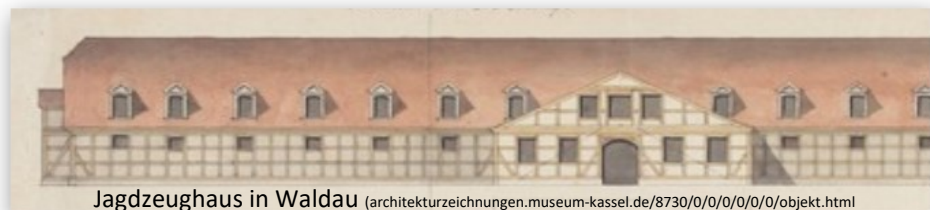
Jagdzeughaus in Waldau ( architekturzeichnungen.museum-kassel.de/8730/0/0/0/0/0/objekt.html )

Die Soldaten waren stationiert in der Nähe ihrer Depots: Die Jäger in