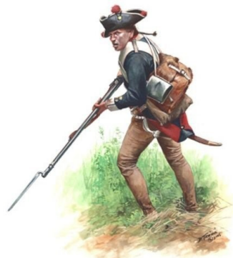
Hessischer Musketier (Troijani)

Sie kämpften nicht wie die Linieninfanterie in Reihe gegen den Feind, sondern in aufgelöster Reihe, versteckten sich, pirschten sich an, schossen aus dem Hinterhalt, was die amerikanischen Soldaten überraschte und irritierte. Aufgrund ihrer Erfolge forderten die Engländer weitere Jäger an, mehr als