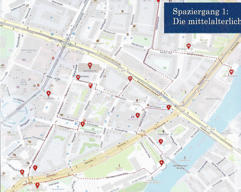
Spaziergang 1: Die mittelalterliche Fachwerkalstadt