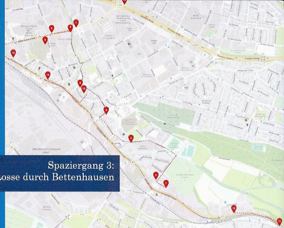
Spaziergang 3: Entlang der Losse durch Bettenhausen