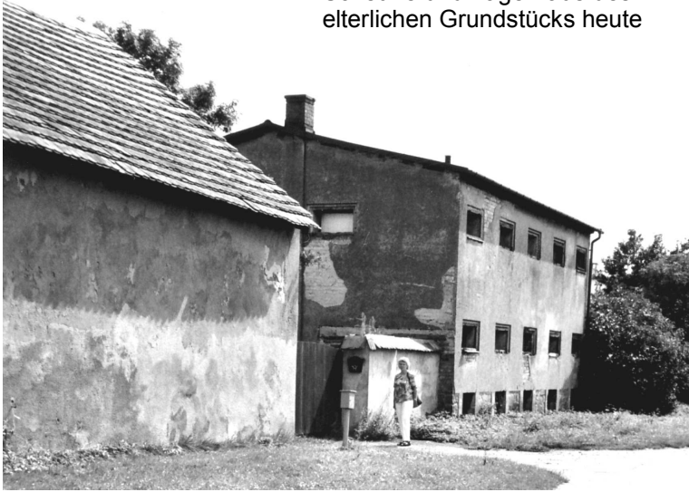
Scheune und Lagerhaus des elterlichen Grundstücks heute