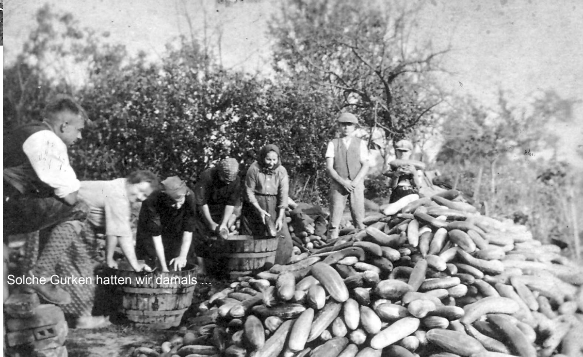
Solche Gurken hatten wir damals ...

Zeiten verbunden mit schwerer Arbeit waren verschwunden wie ein Traum.