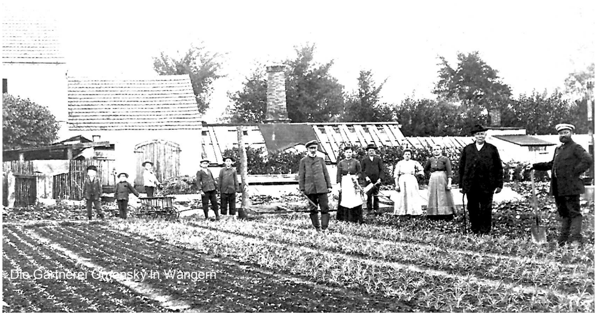
Die Gärtnerer Orenskey in Wangern