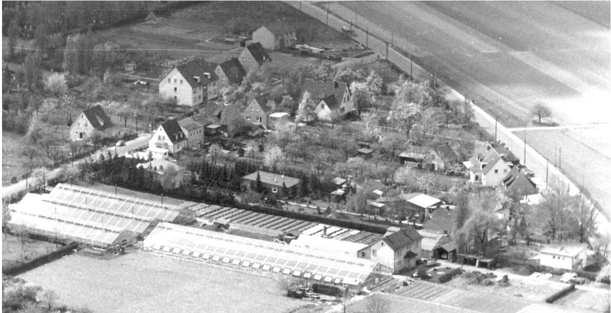
Die Gärtnerei Omonsky im Jahr 1970 in Bettenhausen (Auf dem freien Feld rechts baute später der Baumarkt Max Bahr.