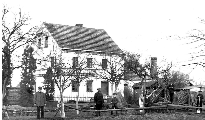
Das Elternhaus in Wangern

Meine Mutter hatte mir eine Drillichtasche von meinem Vater gegeben. Er hatte sie für sein Werkzeug. Zitternd füllte ich sie mit den Papieren. Unter meiner Leibbinde hatte ich mir mit einem Band einen Notgroschen befestigt. Unsere guten