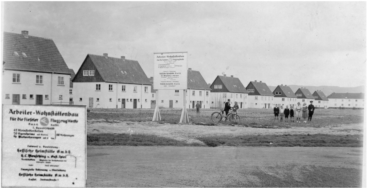
Arbeiter-Wohnstättenbau für die Fieseler Flugzeugwerke