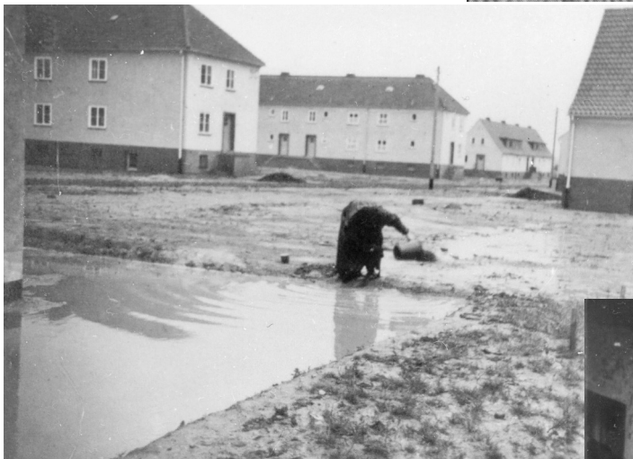
Der große Regen