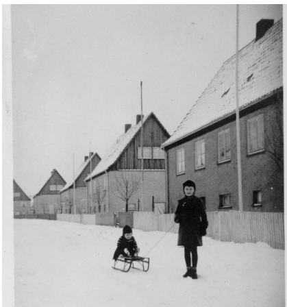
Winter in der Fieseler-Siedlung