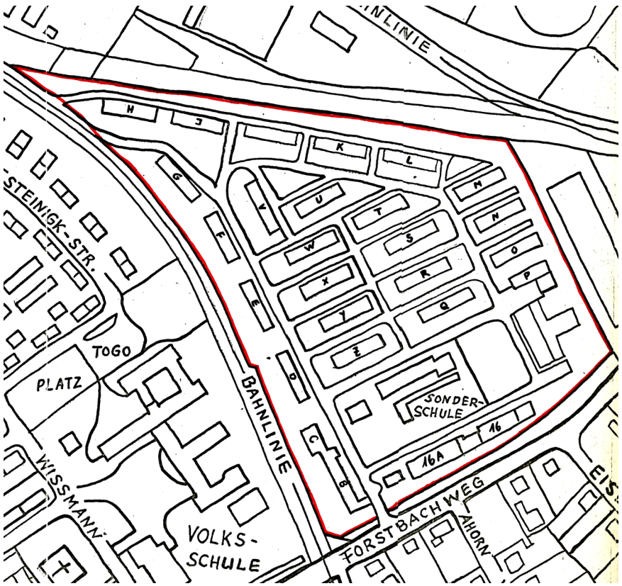
Zeichnung von Bernd Rohde, 1967