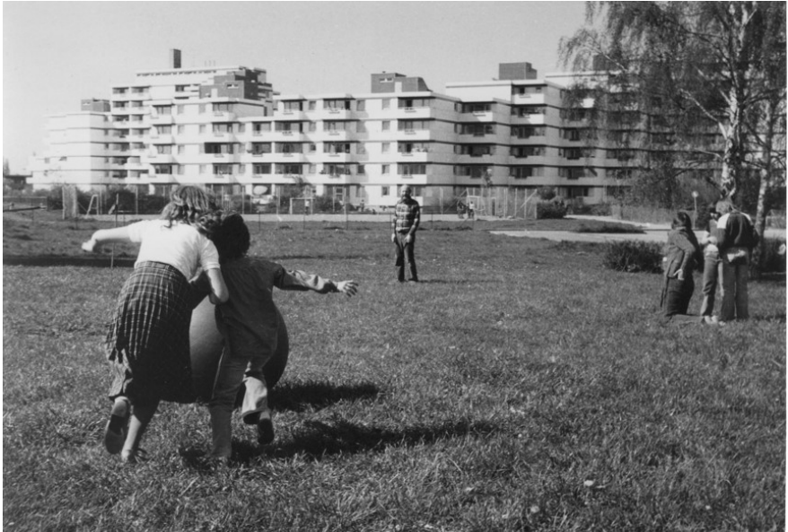
Hier standen einmal die Baracken (1975)