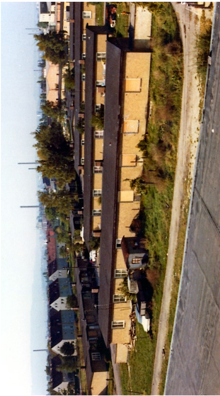
Blick über das Lager, in der vorderen Baracke waren Schulräume für Grundschulkinder aus Forstfeld und vom Lindenberg