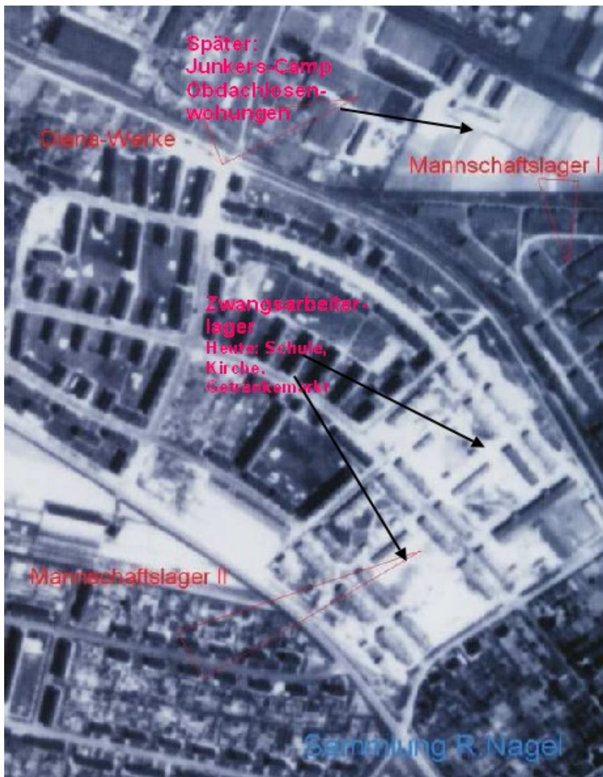
Luftaufnahme der Alliierten vom 24.06.1942