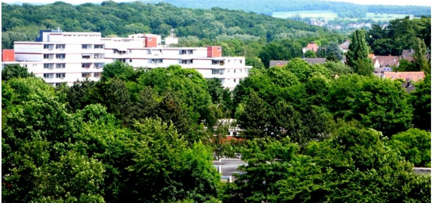
Hier standen einmal die Baracken (2010)