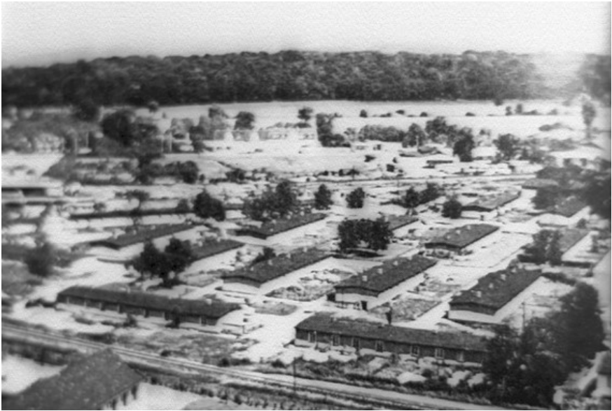
Blick auf das „Lettenlager“ vom Kirchturm aus

Rolf Hochhuth schreibt in seiner Regieanweisung zu seiner Komödie „Die Hebamme“ über die Obdachlosen in seinem Stück: